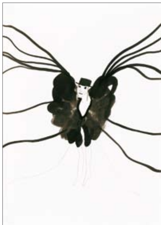
Kathrine Ærtebjerg: Fra serien Moder , 2006. Blæk på papir, A4