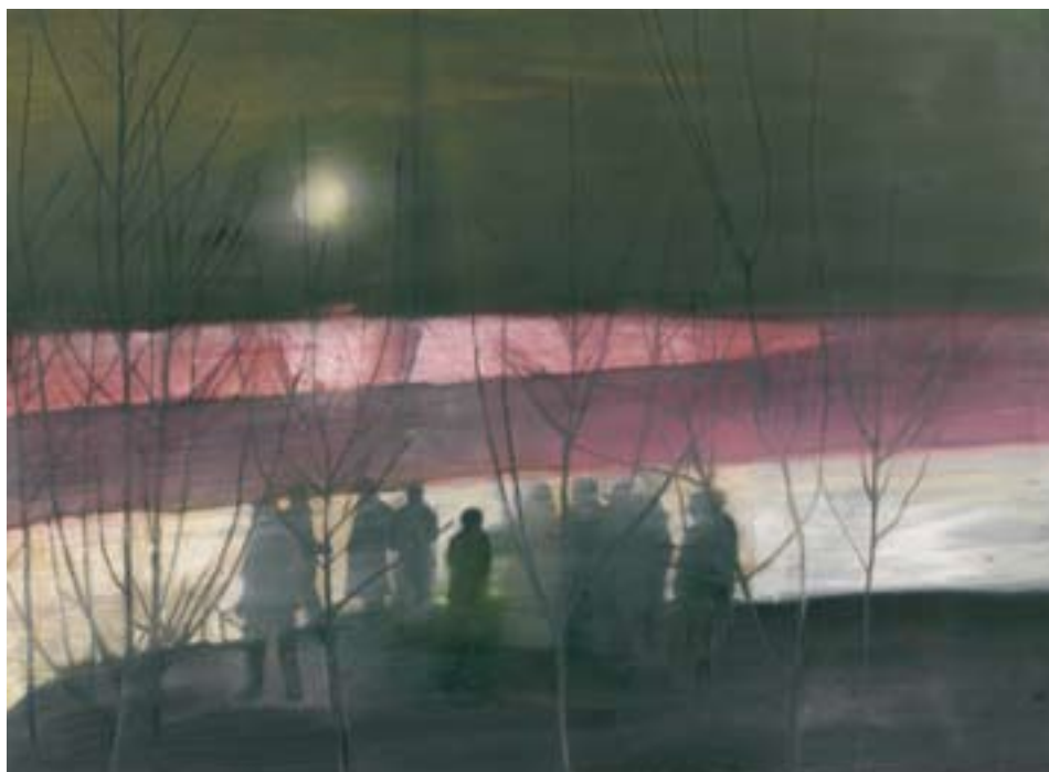
Lærke Lautau: Crowd , 2006. Mixed Media.