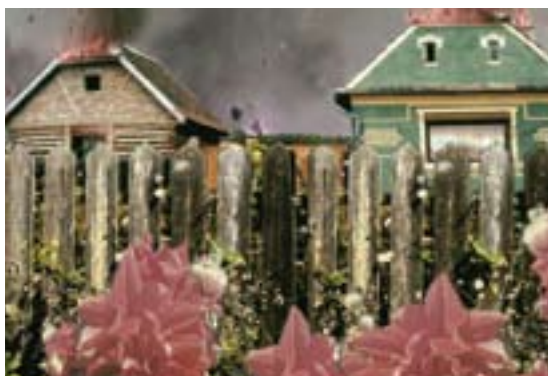
Rikke Benborg: The dream , 2006. Still fra video.