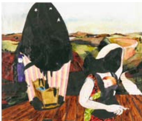
Mie Mørkeberg: Uden titel . 2007. Olie, spray, alcyd og akryl på lærred. 150 x 160 cm.