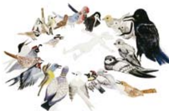
Marika Seidler: Forsamling , 2006. Akvarel. 50 x 60 cm.